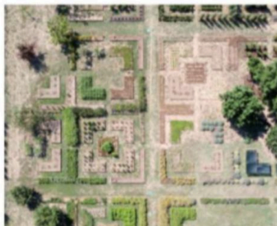
Nelle foto dall'alto, Casa Maria Luigia a Modena e l'orto di Villa Abbondanzi

SERVIZIO E AUTENTICITÀ SONO LE DUE CHIAVI DI ACCESSO A ESEMPI DI OSPITALITÀ UNICA