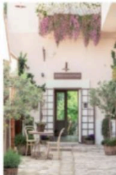
TTG LUXURY 11