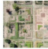
Nelle foto dall'alto, Casa Maria Ligilla a Modena e l'Hotel di Villa Abbondanti a Ferrara. Nella foto sotto, da sinistra, il Borgo San Giacomo, Case Arzago sull'Elba e Borgo San Giacomo a Bercallia