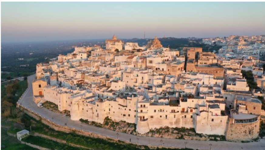
Ostuni, la "città bianca" della Puglia.

vedere e fare: Con le sue acque turchesi, scogliere calcaree, uliveti e tante antichità Misseriya (agriturismo), la Puglia – il tacco regionale della scarpa – è l'antitesi polare della frenetica capitale italiana della moda. Più recentemente, è diventato un hotspot tra il Mar Adriatico e il Mar Ionio.